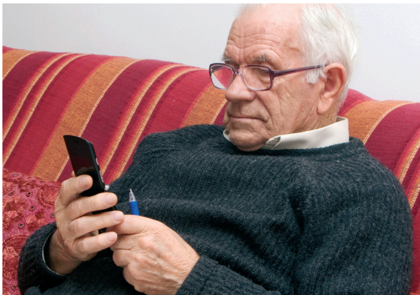
Mit AAL können viele Menschen ihren Alltag selbständig gestalten.

Klar ist: Das deutsche Gesundheitssystem kann den steigenden Pflegebedarf nur schultern, wenn Alternativen