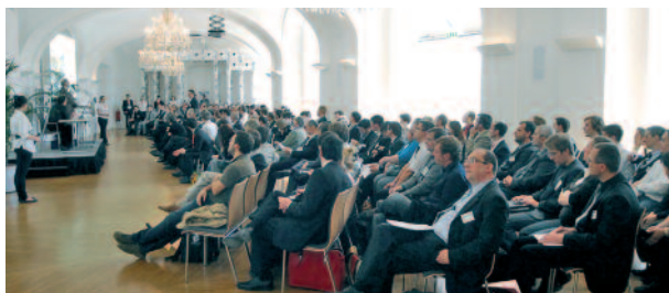
Gut besucht: Die eHealth 2010 in Wien.