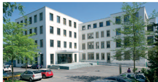
Die neue Geschäftsstelle der SGTMeH in der AMTS in Luzern.

Der 24. August 2010 bedeutete auch den offiziellen Startschuss zur Professionalisierung der SGTMeH mit einer neuen Geschäftsstelle. Die SGTMeH ist jetzt in den Räumlichkeiten der AMTS stationiert, der Akademie für medizinisches Training und Simulation in Luzern. Damit verbunden ist eine intensive Zusammenarbeit mit der AMTS, die sich bereits in kurzer Zeit zur führenden multidisziplinären und inter-